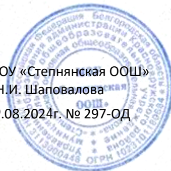
ГРАФИК ЗАНЯТОСТИ ХИМИЧЕСКОЙ И БИОЛОГИЧЕСКОЙ ЛАБОРАТОРИИ